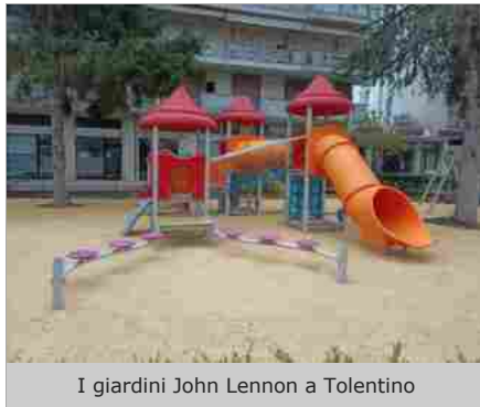
I giardini John Lennon a Tolentino

6 Maggio 2022 - Ore 14:06 - caricamento letture