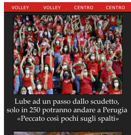
Lube ad un passo dallo scudetto, solo in 250 potranno andare a Perugia «Peccato così pochi sugli spalti»

pavimentazione nasce dalla collaborazione tra il Comune di Tolentino e Eso Società Benefit e l'Associazione Gogreen, nell'ambito delle iniziative a favore dello sviluppo di progetti di economia circolare. Dopo il taglio del nastro seguiranno la benedizione e il saluto del sindaco e delle autorità presenti oltre che dei progettisti e delle ditte che hanno realizzato i lavori.