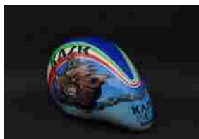
L'arte in testa al Museo del Ghisallo