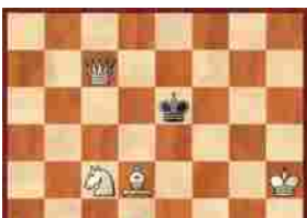
Wojtyla e gli scacchi: il riconoscimento della FIDE