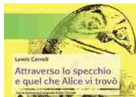
“Attraverso lo specchio” antesignano dei romanzi scacchistici