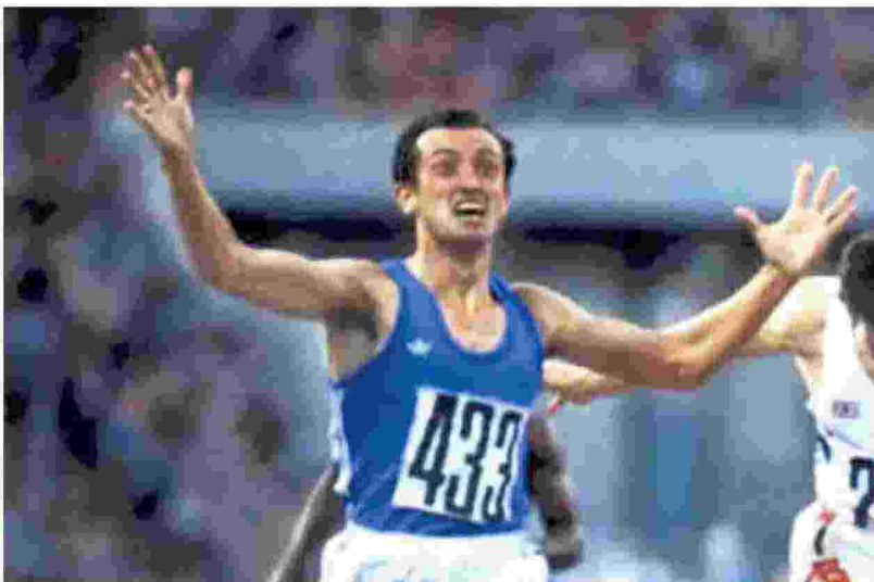
▲ Primatista mondiale Pietro Mennea fu anche olimpionico